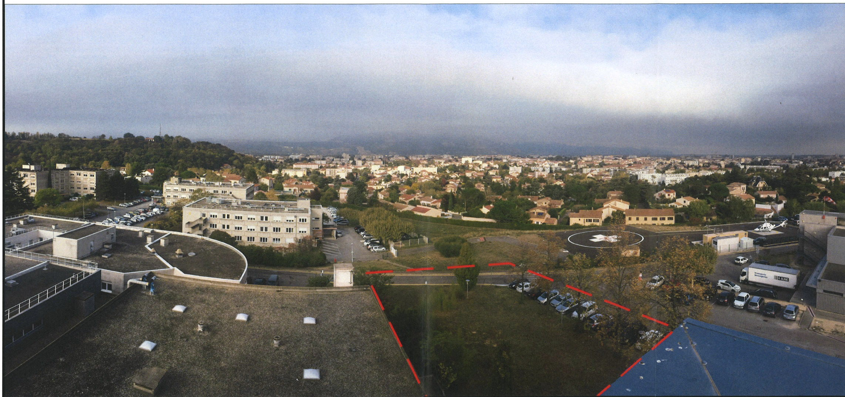
Emplacement du nouveau bâtiment et hélistation actuelle Photo du 16/10/2017 à partir des toitures existantes contiguës au projet