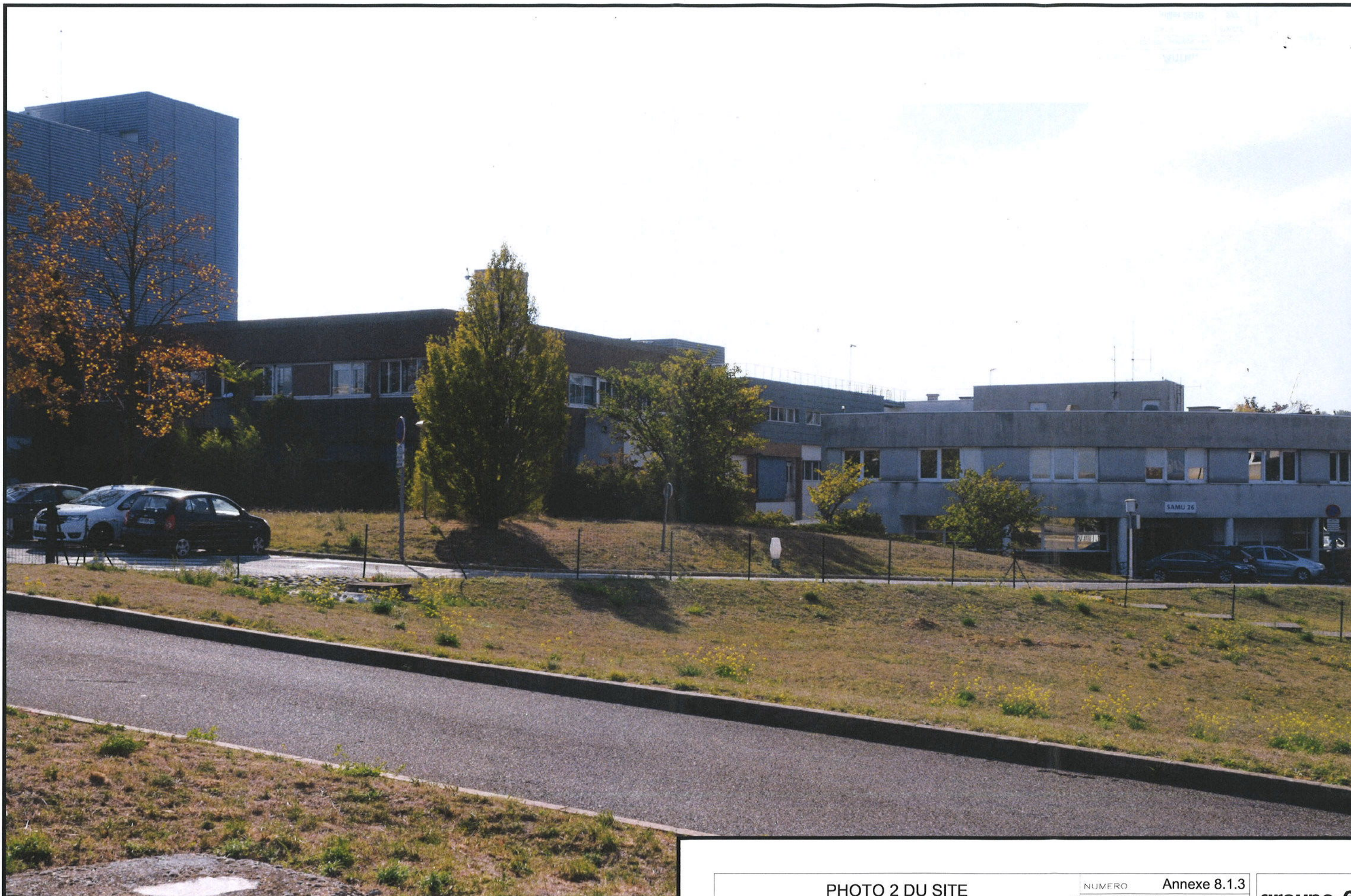
Emplacement du nouveau bâtiment - Photo du 16/10/2017 (prise du NO)